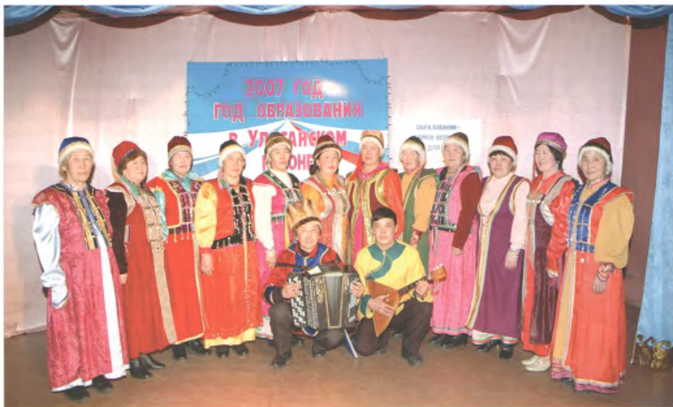
Фольклорный ансамбль «Чалын»