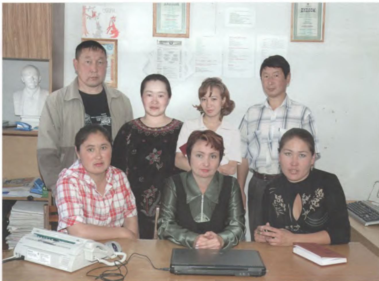
Коллектив редакции газеты «Улаганнын солундары». 2009 г.

В 1970-е годы по всей стране особо популярными стали вокально-инструментальные ансамбли, в репертуаре которых звучали ритмичные эстрадные песни и электронная музыка в сочетании с народными, классическими мелодиями и рок-музыкой. На этой волне в 1985