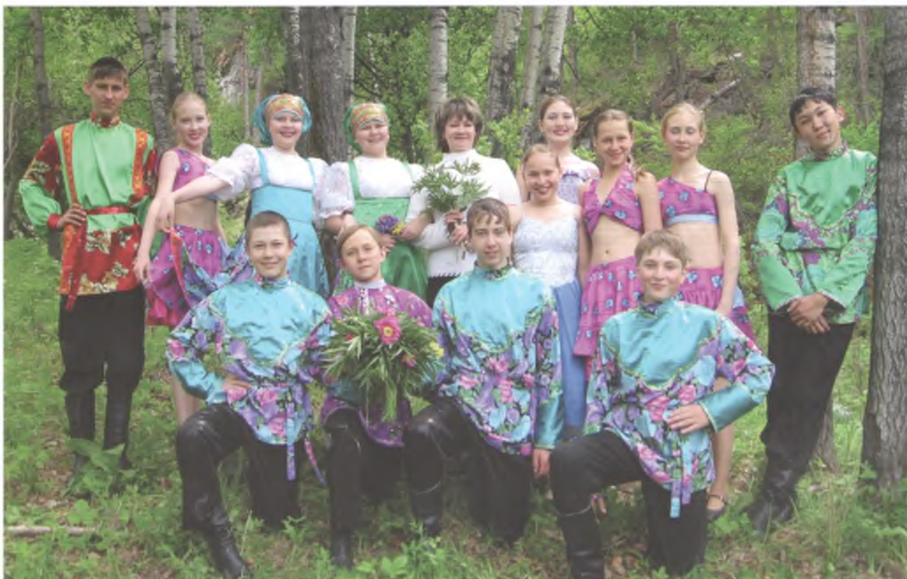
Народный хореографический ансамбль «Чейне»