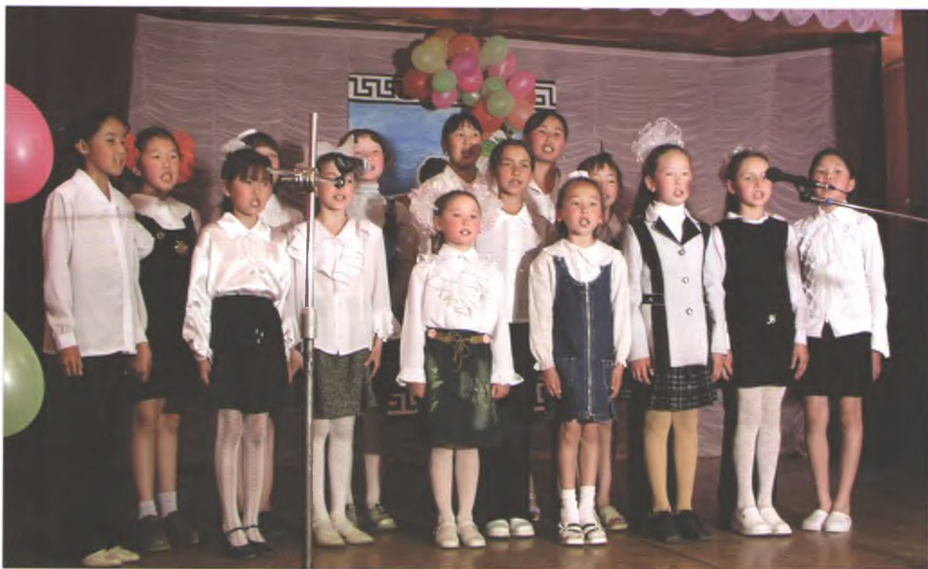
Воспитанники ДШИ с. Улаган. 2000 г.