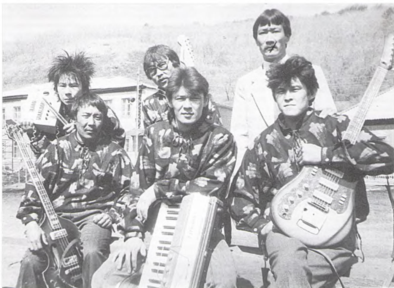
Группа «Амаду». 1980-е гг.