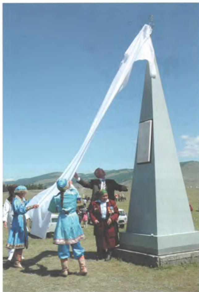
Открытие стелы «Центр тюркской культуры»