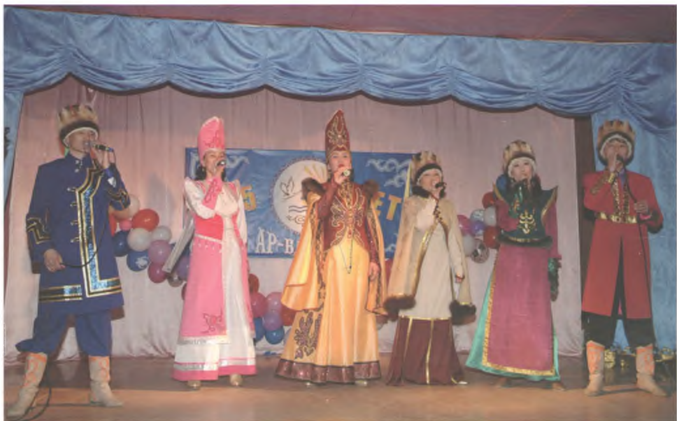
Группа «Ар-Башкуш». 2009 г.