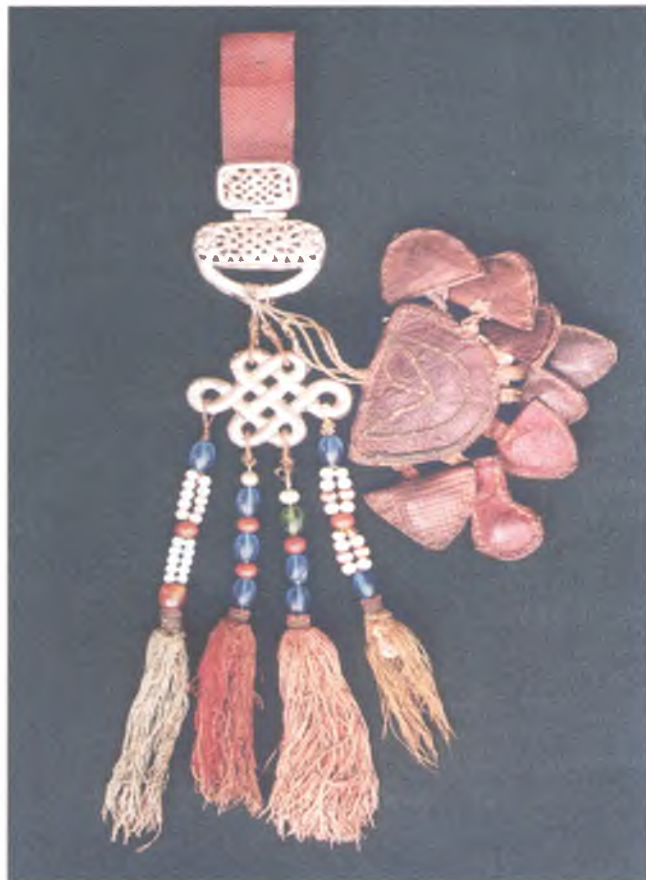
Женское поясное украшение

Девочки до совершеннолетия оставляли на лбу маленькую челку – «чүрмеш», заплетали в косички свои волосы по обе стороны от висков и украшали их бусин-