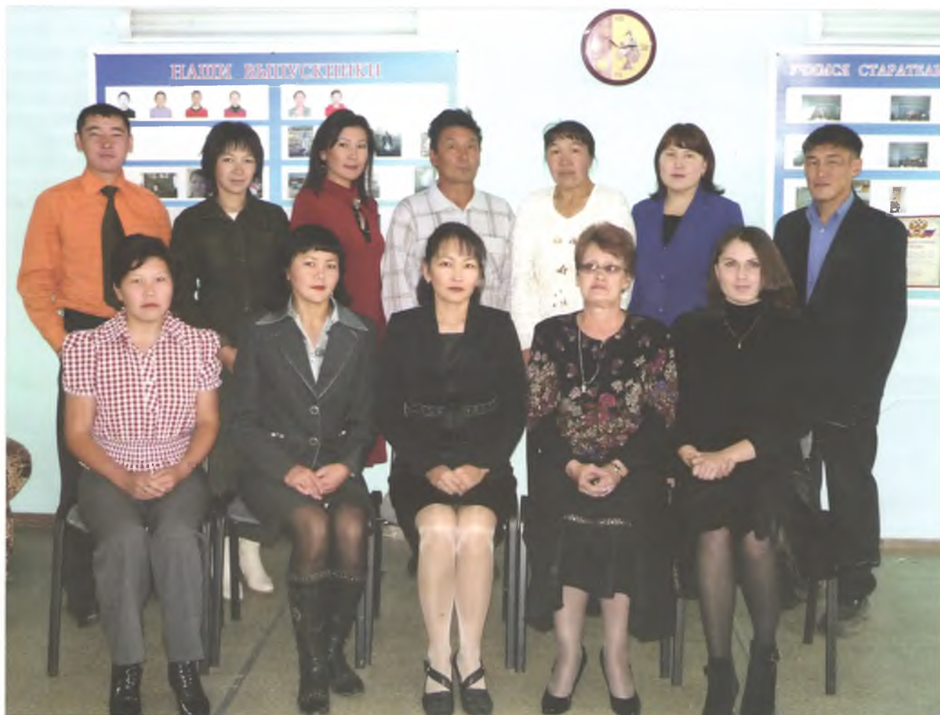
Коллектив ДШИ с. Улаган. 2009 г.