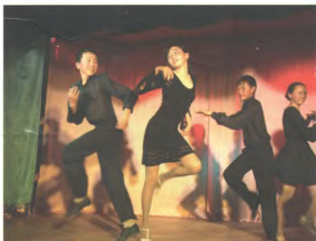
Хореографический ансамбль «Айас»