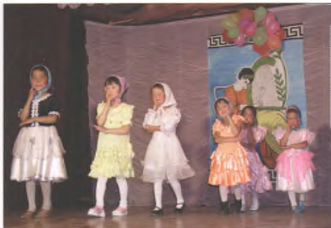
Младшая группа ДШИ с. Улаган