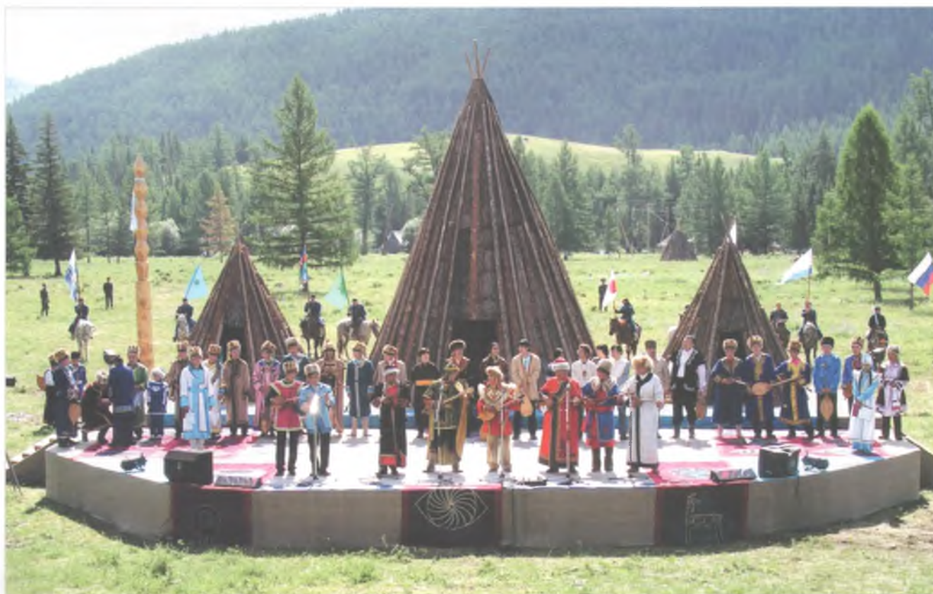
На Первом Международном курултае исполнителей горлового пения. 2004 г.