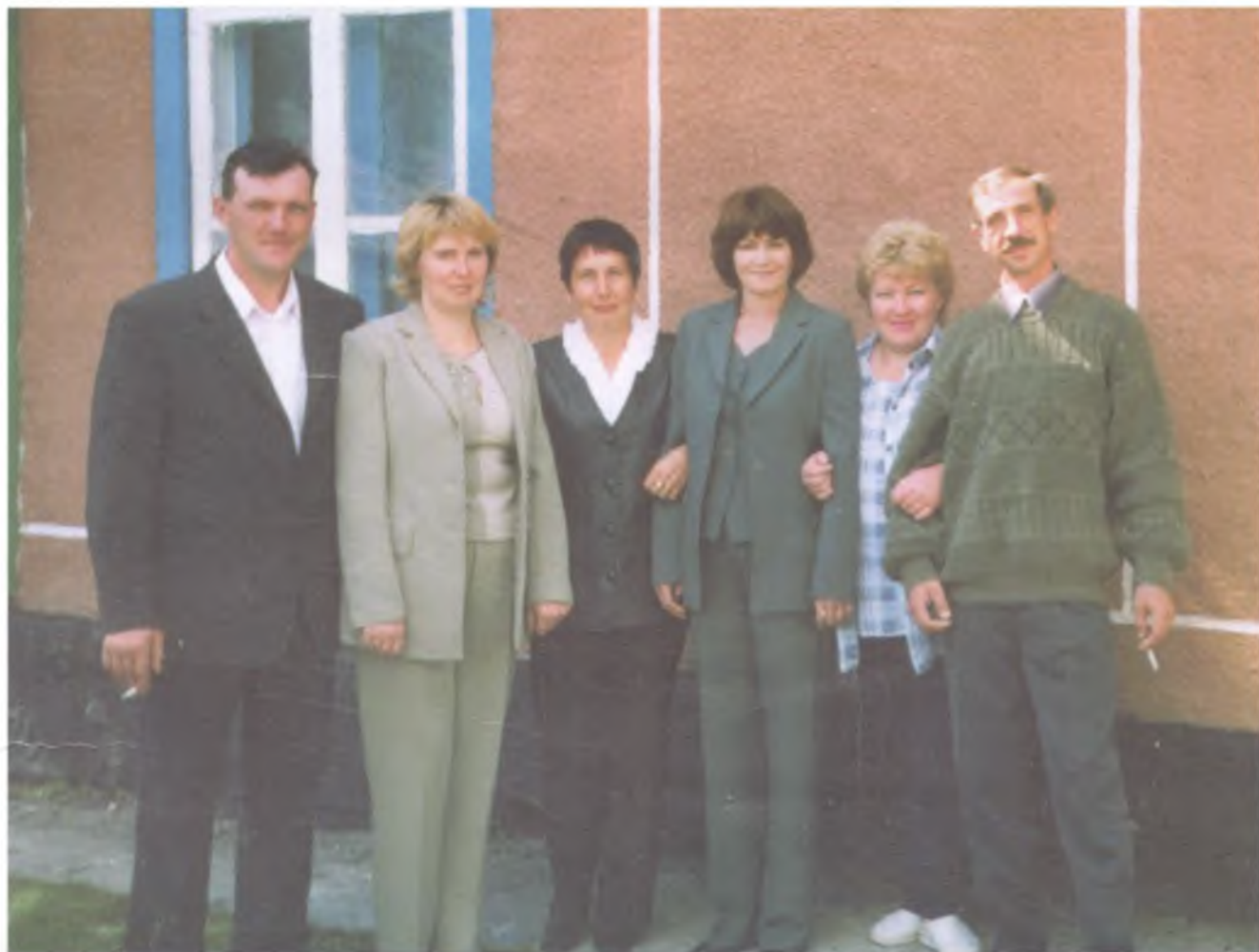
Коллектив Акташской музыкальной школы