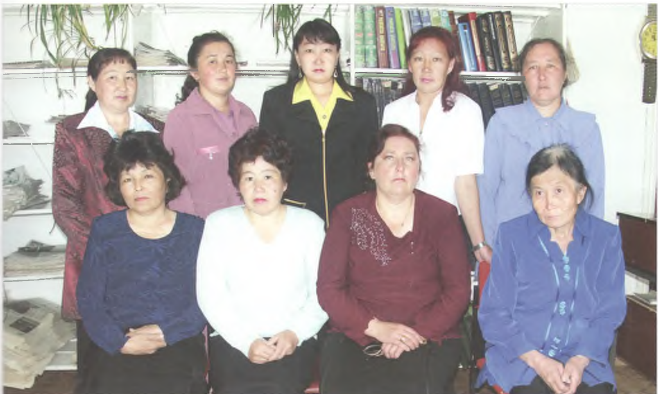
Коллектив Улаганской районной библиотеки. 2000 г.

В освещении культурного наследия района немаловажную роль играет историко-этнографический музей «Пазырык», который был открыт в селе Улаган в 1998 году. Основной целью создания музея являются изучение, сбор, сохранение, представление и популяризация археологических памятников различных исторических культур, предметов материальной и духовной культуры теленгитов. Работа по созданию районного музея была